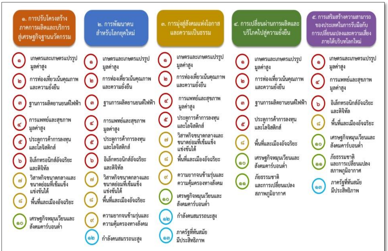
แผนภาพที่ ๑ ความเชื่อมโยงระหว่างหมุดหมายการพัฒนา กับเป้าหมายหลัก

ความเชื่อมโยงระหว่างหมุดหมายการพัฒนา กับเป้าหมายหลักแสดงไว้ในแผนภาพที่ ๑ โดยหมุดหมายการพัฒนาที่กำหนดขึ้นเป็นประเด็นที่มีลักษณะเชิงบูรณาการที่ครอบคลุมการพัฒนาตั้งแต่ในระดับต้นน้ำจนถึงปลายน้ำ และสามารถนำไปสู่ผลพัฒนาทั้งในมิติเศรษฐกิจ สังคม ทรัพยากรธรรมชาติและสิ่งแวดล้อมไปพร้อม ๆ กัน ทำให้หมุดหมายแต่ละประการสามารถสนับสนุนเป้าหมายหลักได้มากกว่าหนึ่งข้อ นอกจากนี้การพัฒนาภายใต้แต่ละหมุดหมายไม่ได้แยกขาดจากกัน แต่มีการสนับสนุนหรือเอื้อประโยชน์ซึ่งกันและกัน